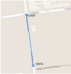
Trasa 800 m: