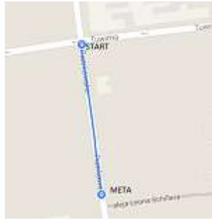
Trasa 1300 m: